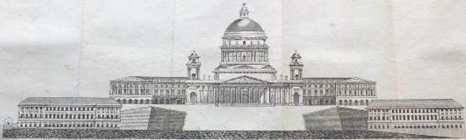
Ant. Antwerp. Fe. Tempel